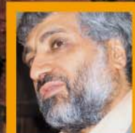
هویت سوری و چشم‌انداز فرهنگی منطقه دکتر ابراهیم فیاض